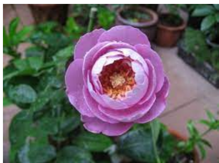
BOUL DE PARFUM- JAPĀNAS

Floribundroze. Skaisti , pildīti ziedi ar podziņu vidū. Sāk ziedēt krēmkrāsā izziedot mainās tonis uz rozā. Spēcīga auguma, smaržīga, izturīga. H-0,9m