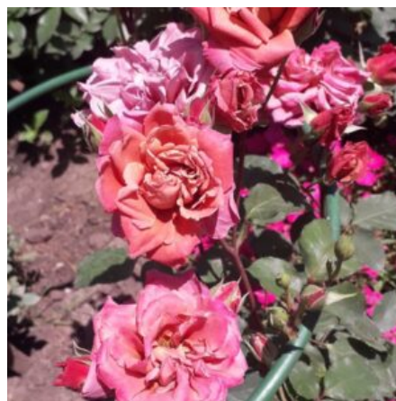
CHA CHA- JAPĀNAS

KRŪMROZE.Krāšņi ziedi ar maigām zilgani purpursarkanām nokrāsām un zeltainu centru. Var audzēt podos.Izteikta smarža. H-1m